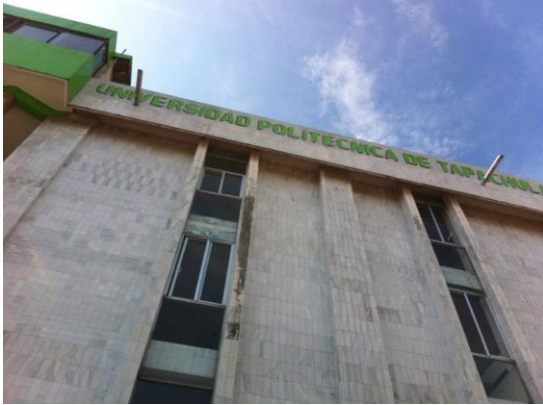
5ta. Poniente y 2da norte