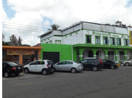
Av. Palmas Fracc. Laureles